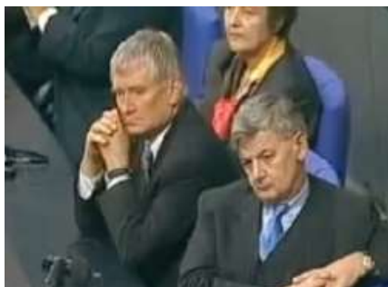
Otto Schily, Herta Däubler-Gmelin y Joschka Fischer durante el discurso de Putin en la cámara baja del parlamento federal [Bundestag] en 2001.

Y, por supuesto, tampoco nada se cuenta de la ruptura de las promesas mutuas. Nada acerca de que ya la expansión de la OTAN hasta la frontera rusa fue una perniciosa ruptura de la confianza. Nada acerca del hecho y del modo en que Occidente intentó interferir en los asuntos internos de Rusia durante el mandato del presidente ruso Yeltsin. Sobre estas increíbles maquinaciones presentó Naomi Klein un informe impresionante en su libro «La doctrina del shock» 9 El libro apareció en Alemania en 2007 y se lo relegó, con sorprendente éxito, al olvido.