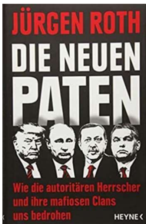
La tapa de Die neuen Paten [Los nuevos padrinos] 47

Al informar y comentar procesos muy diferentes, me había llamado la atención, que varios observadores de los acontecimientos tenían la tendencia de yuxtaponer a personas que yo, ingenuamente, consideraba como individuos. La yuxtaposición había, evidentemente, de servir a una caracterización unitaria; podría hablarse también de estigmatización. Si se yuxtapone a Trump, Erdoğan, Salvini, Putin y otros, colocándolos